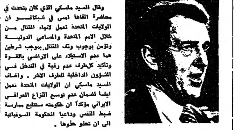
صدام حسين: العراق يفتتح بوضع اقتصادي جديدي رغم ظروف الحرب